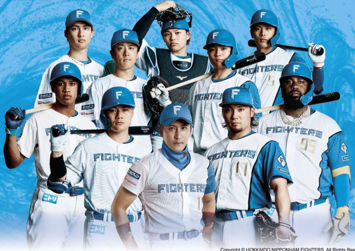
Copyright © HOKKAIDO NIPPONHAM FIGHTERS. All Rights Reserved.

招待試合 8/13(木) 18:00 試合開始 VS. 埼玉西武ライオンズ エスコンフィールド HOKKAIDO