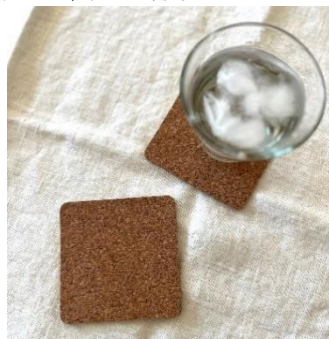
コースター四角型(3P) (税込500円)