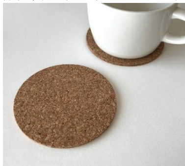
コースター丸型(3P) (税込500円)